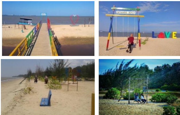
Gambar 4.1 Spot Foto di Pantai Sipakario

Tempat wisata ini telah menyediakan berbagai spot foto dengan berbagai tema. Ada tema seperti jembatan, romansa, pelestarian lingkungan, bahkan tema keluarga. Pengunjung bisa mencoba semua spot yang sudah disediakan sebagai background foto.